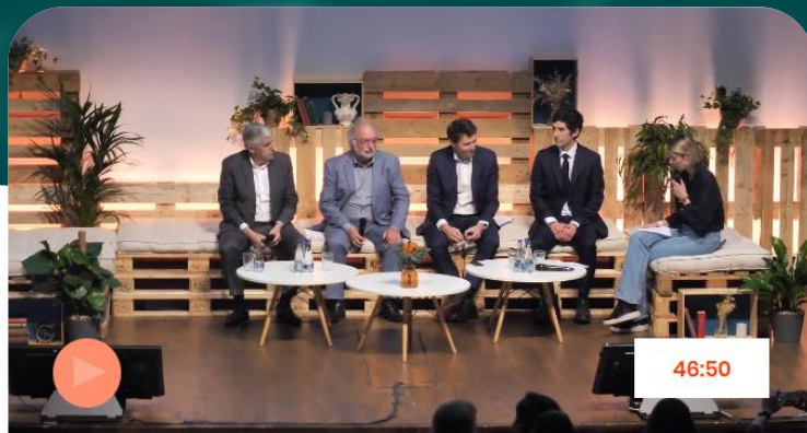
Table ronde - Contribution au territoire : comment les grands acteurs économiques régionaux peuvent renforcer l'économie locale ?