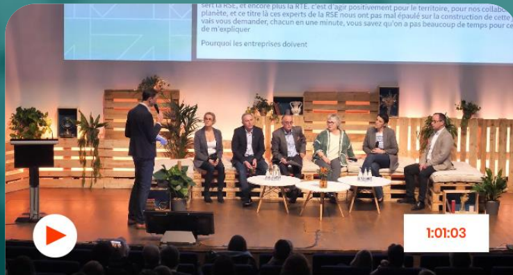
Plénière d'ouverture - Résolution 2024

11 AVRIL 2024 AU PALAIS DES CONGRÈS DE BORDEAUX