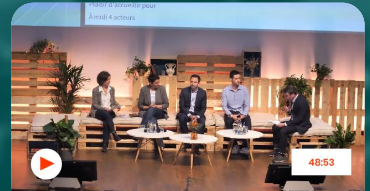
Table ronde - Transition énergétique : comment tendre vers la neutralité carbone ?