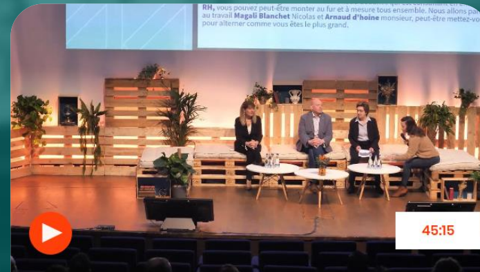
Table ronde - QVCT & Santé en Entreprise : Entre burn-out et babyfoot, comment maintenir une QVCT optimale ?