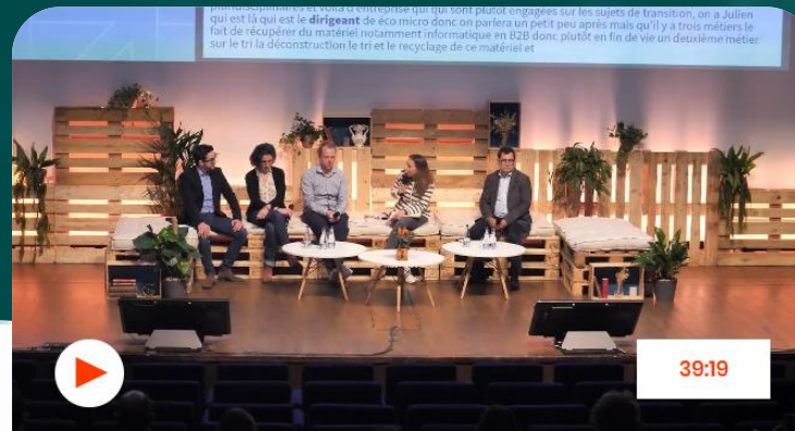
Table ronde - Économie circulaire : pourquoi ça ne tourne pas encore tout à fait rond ?