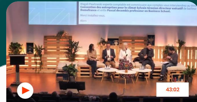
Table ronde - Finance durable et dynamique territoriale